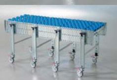
Les flexi-convoyeurs peuvent être orientés et allongés selon la disposition souhaitée. Leur longueur est réglable entre 1 520 mm et 5 350 mm.