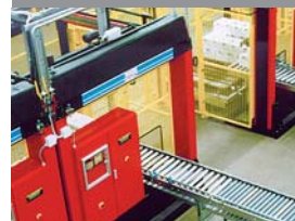
Altmark Käserei, Allemagne