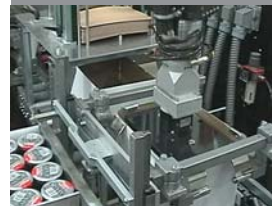
Sig. Ágústsson, Islande