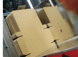
Geberit AG, Suisse