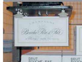
Bouché Père & Fils, France