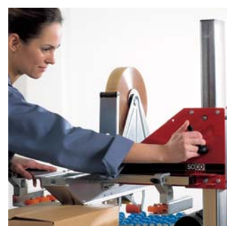
Le réglage d'un nouveau format de carton est rapide et simple.