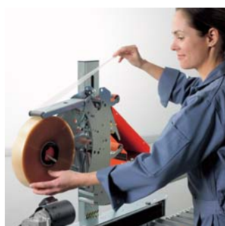
Les distributeurs de ruban adhésif SOCO SYSTEM sont le fruit de nombreuses années de développement et d'utilisation. Ils constituent aujourd'hui un outil optimal.