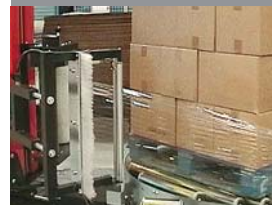
United Milk, Royaume-Uni

SOCO SYSTEM S.A. Avenue des deux Vallées Zone d'Activités Actipôle de l'A2 F-59554 Raillencourt Sainte Olle France Tél. 03 27 729 729 Fax 03 3 27 729 730 info@socosystem.fr www.socosystem.fr